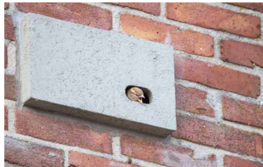
Huismuskast (inbouw) van Unitura.

Voorkom vertraging neem natuurinclusieve maatregelen al in de ontwerpfase mee