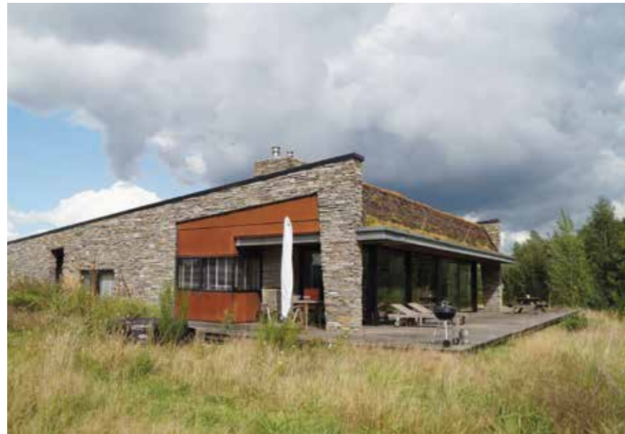
Zo kan het ook: woning en erf gaan op in het landschap.