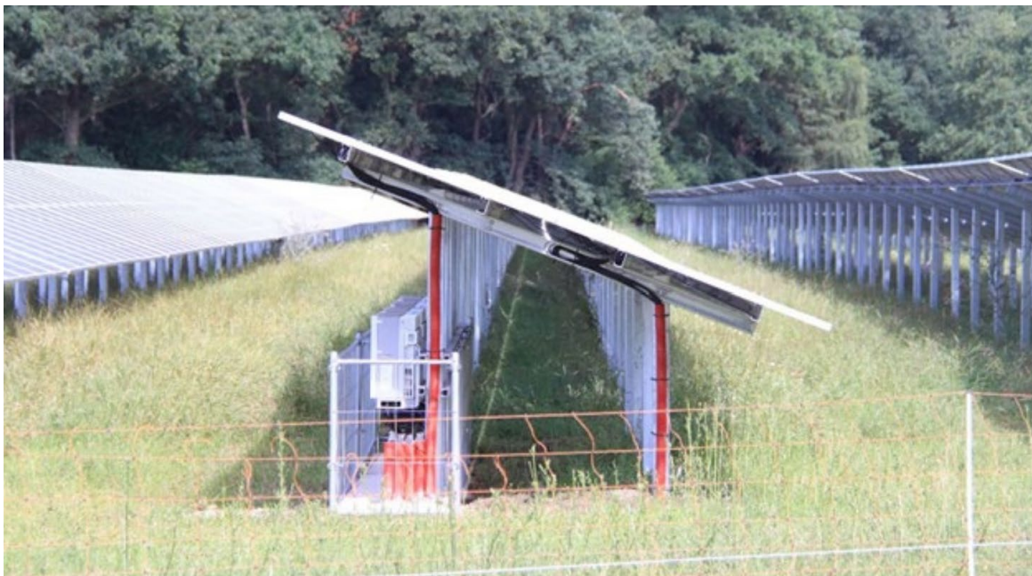
Technische installaties goed beschermd met een klein hekwerk er direct omheen.

Zorg voor een goede afscherming van alle kwetsbare installatiedelen, zodat schapen er niet bij kunnen. Dit voorkomt beschadiging van apparatuur én mogelijke verwondingen bij dieren.