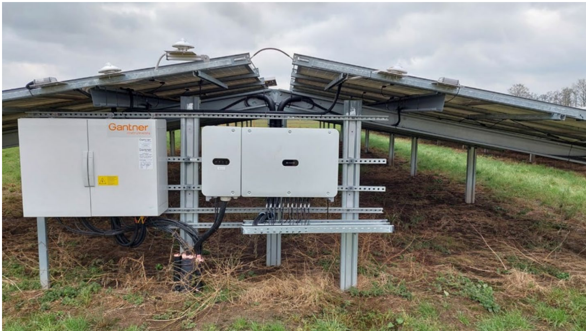
Technische installaties niet goed beschermd